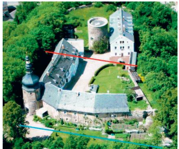
Juni 2006: Schloss Wiesenburg von Südosten. Luftbilder zur 850-Jahr-Feier Wiesenburg/Wies.

In folgendem Luftbild ist oberhalb (nördlich) der roten Linie, die den ursprünglichen (ersten) Zwinger markiert, die Burg Wiesenburg (Palas, Bergfried, Torgebäude, Torturm) dargestellt. Zwischen roter Linie und blauer Linie, die den zweiten (äußeren) Zwinger kennzeichnet, steht das ab 1664 errichtete Holsteiner Schloss.