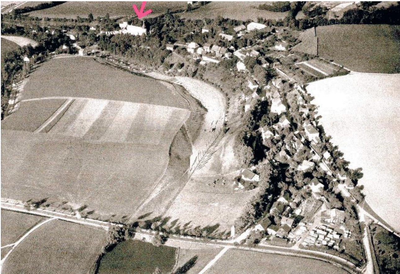
Lage von Schloss Wiesenburg (Pfeil) innerhalb der Ortslage Wiesenburg. Norden ist links oben. Rechts (südlich) vom Schloss das Rittergut Wiesenburg. Die Karl-Marx-Siedlung (Scheibe), linke Bildhälfte, zeigt sich noch als zusammenhängender Rittergutsschlag, an den sich der Goldbachgrund (Bildmitte) anschließt. Im unteren Bildbereich die Bundesstraße 93 und der Schafteich. Luftbild aufgenommen zwischen 1932 und 1938.