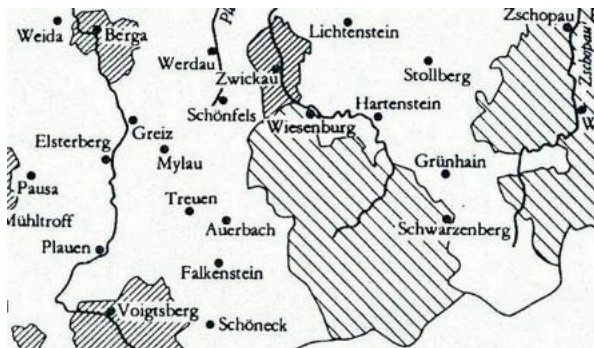
Mittelalterliche Herrschaft Wiesenburg (gestreift, Bildmitte, davon etwa die nördliche – obere – Hälfte) im Jahre 1378. Auszug aus einer Karte in: BLASCHKE, Karlheinz: Geschichte Sachsens im Mittelalter . Berlin 1990, S. 284.

Die Burg Wiesenburg erfüllte die Funktionen eines Rodungszentrums während der mitteldeutschen Ostexpansion: Erstens war die Burg derjenige Ort, von dem aus die Vögte VON WEIDA oder ihre Mannen die Besiedlung großer Flächen südlich des Offenlandes des Zwickauer Gaues organisierten. Zweitens schützte ihre Besatzung die direkt unterhalb der Burg gelegene Furt durch die Zwickauer Mulde an einem Ost-West-verlaufenden Altweg. Die Zwickauer Mulde war Grenze zwischen der pleißenländischen Herrschaft Wiesenburg am linken Muldenufer und den (bald) burggräflich-meißnischen Territorien um Hartenstein und Wildenfels am rechten Muldenufer. Drittens markierte der Adelssitz nahezu die nördliche Grenze der Herrschaft Wiesenburg. Aufgrund dieser Lage konnten die Wiesenburger gut mit westlich, nördlich und östlich benachbarten mittelalterlichen Herrschaftszentren (Schönfels, Zwickau, Wildenfels, Hartenstein, Stein) kommunizieren oder diese auch jederzeit hinsichtlich von Gefahren beobachten.