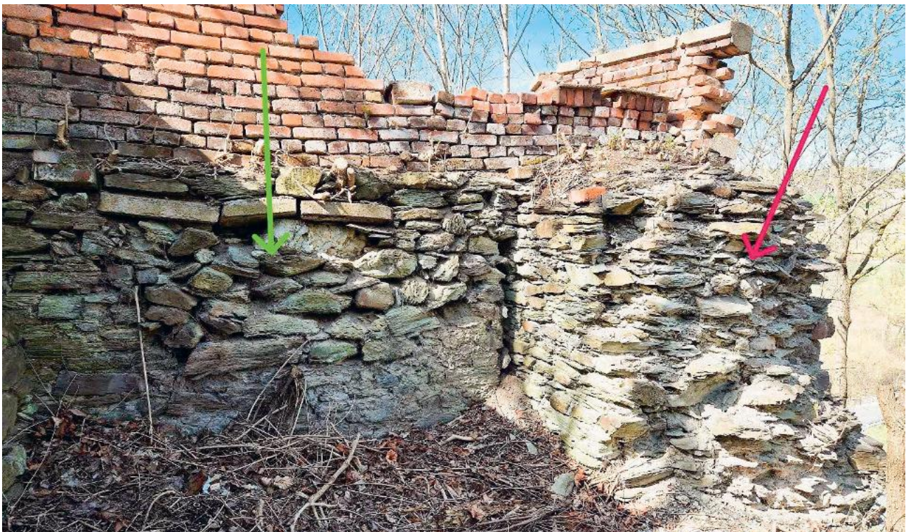
11. April 2026: Bauliche Anomalie (Einbuchtung) an der nordöstlichen Ecke des hinteren Schlosshofes. Der rote Pfeil markiert die ursprüngliche Ringmauer. Von dieser zweigt (unverbunden) eine offenbar mittelalterliche Mauer (grüner Pfeil) rechtwinklig ab. Diese könnte zu einem früheren, unbekanntem Bau im hinteren Schlosshof gehören. Lutz KNÖRNSCHILD, Wiesenburg.