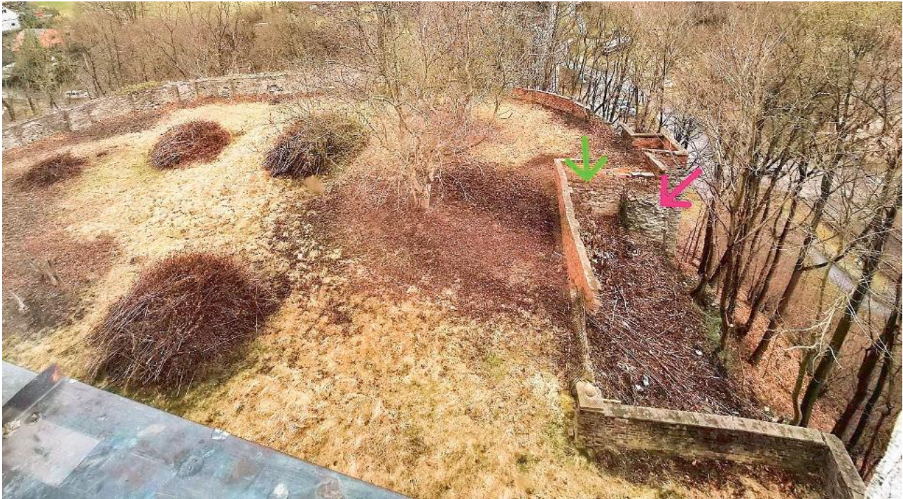
25. März 2026: Bauliche Anomalie (Einbuchtung) an der nordöstlichen Ecke des hinteren Schlosshofes. Der rote Pfeil markiert die ursprüngliche Ringmauer. Von dieser zweigt (unverbunden) eine offenbar mittelalterliche Mauer (grüner Pfeil) rechtwinklig ab. Diese könnte zu einem früheren, unbekanntem Bau im hinteren Schlosshof gehören. Lutz KNÖRNSCHILD, Wiesenburg.